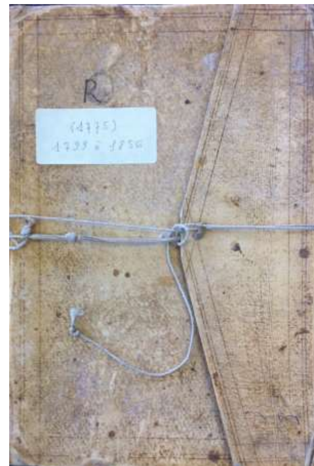
Figure 2 Registres des délibérations de la Champagne-en-Valromey D1